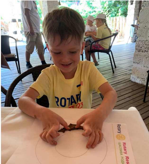
Рис. 2. Робота з пластиліном під час створення мандали «Мій емоційний Всесвіт».