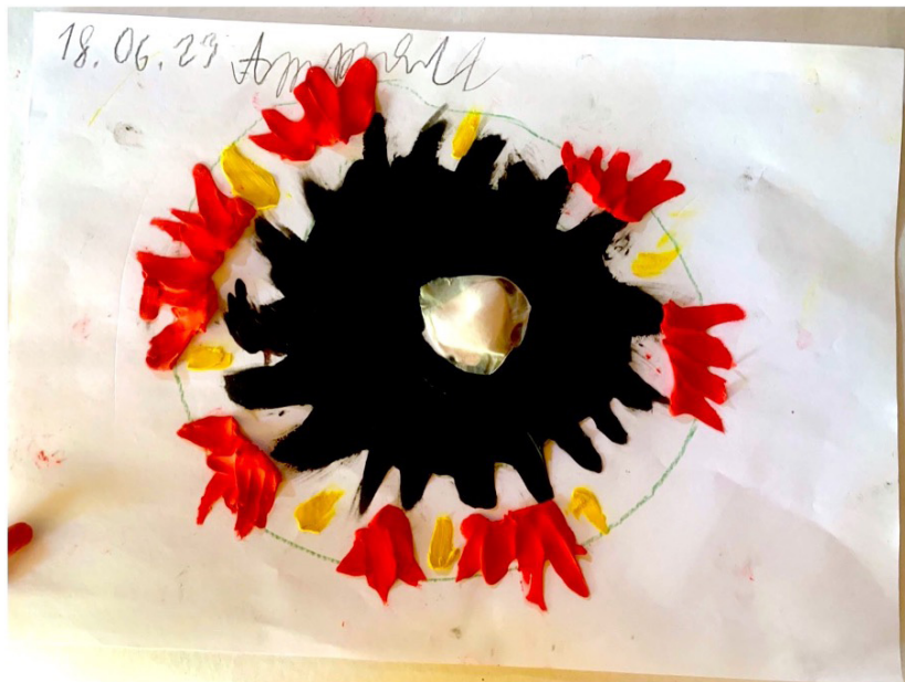
Рис. 3. Творчий продукт за методикою «Мій емоційний Всесвіт» Артема, 7 років..