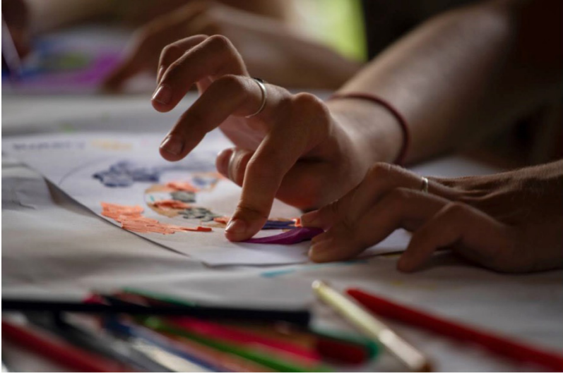
Рис. 1. Нанесення пластиліну під час створення мандали «Мій емоційний Всесвіт».