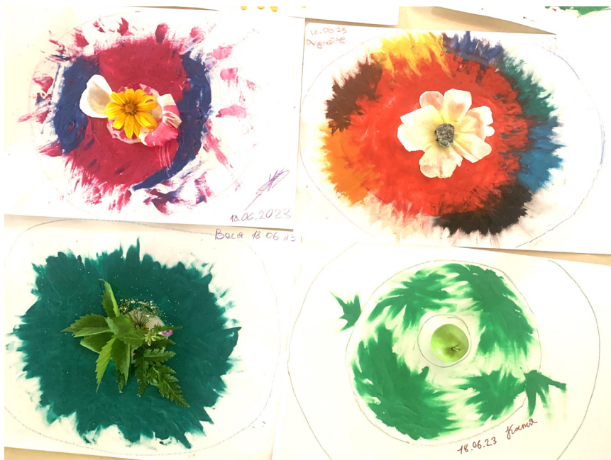
Рис. 1. Приклади творчих продуктів дітей за методикою «Мій емоційний Всесвіт».