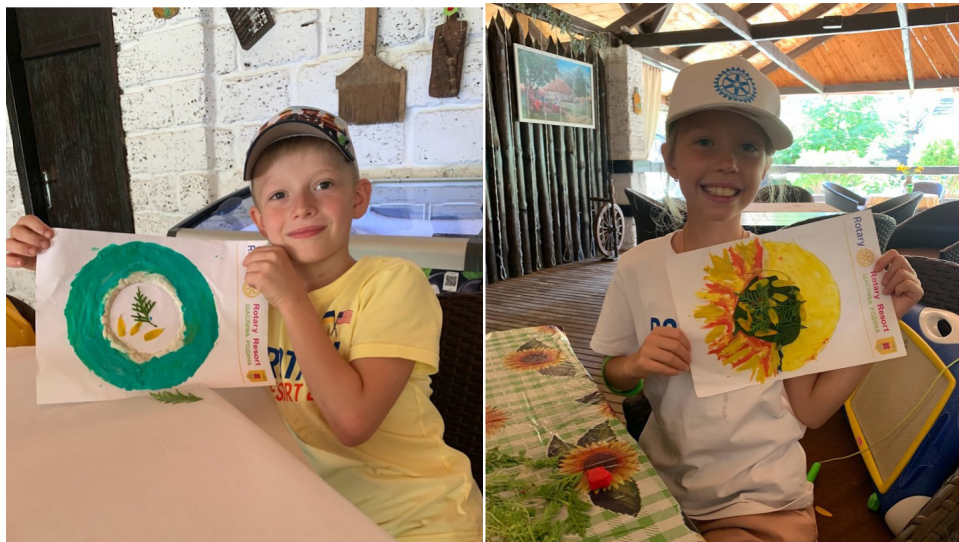
Рис. 1-2. Відмінності творчих продуктів за методикою «Мій емоційний Всесвіт» у хлопців та дівчат.